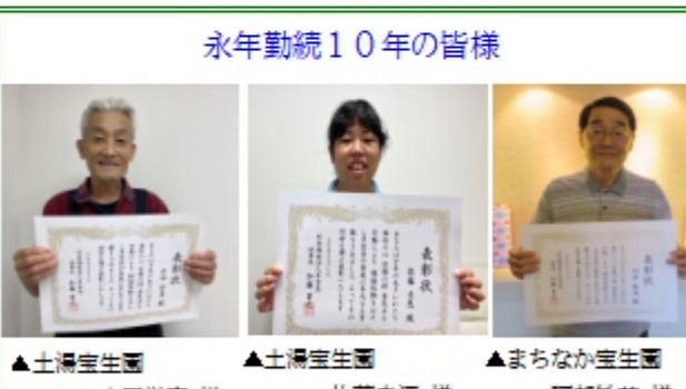
永年勤続10年の皆様