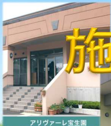
アリヴァーレ宝生園