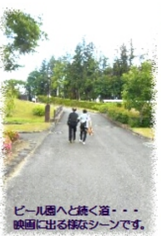
ピール園へと続く道... 映画に出る様なシーンです。

何ととっても「父」の日ですから、この日はやはりハレと行きたいものです。と、言うわけで「四季の里・ピール園」へ繰り出しました。さて、何を